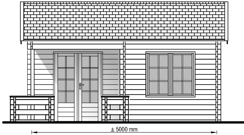
Zij aanzicht Seiten Ansicht Side view

Het is niet toegestaan om bouwsystemen, bouwtekeningen en foto's van zowel de Prima-serie als de Loghouth-serie te kopiëren of gedeeltes daarvan te verspreiden zonder schriftelijke toestemming van LUGARDE, LUGARDE B.V. of LUGARDE HOLLAND, te Wierdenweg 10, 3713 JZ Dordrecht, The Netherlands. Het Prima 3+1 systeem is een geregistreerd handelsmerk. Het Prima 3+1 systeem is ontwikkeld en gepatenteerd door LUGARDE/Wuestman B.V.